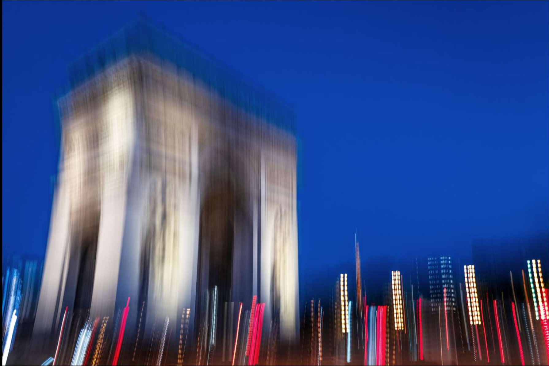
Variante Arc de Triomphe spectral