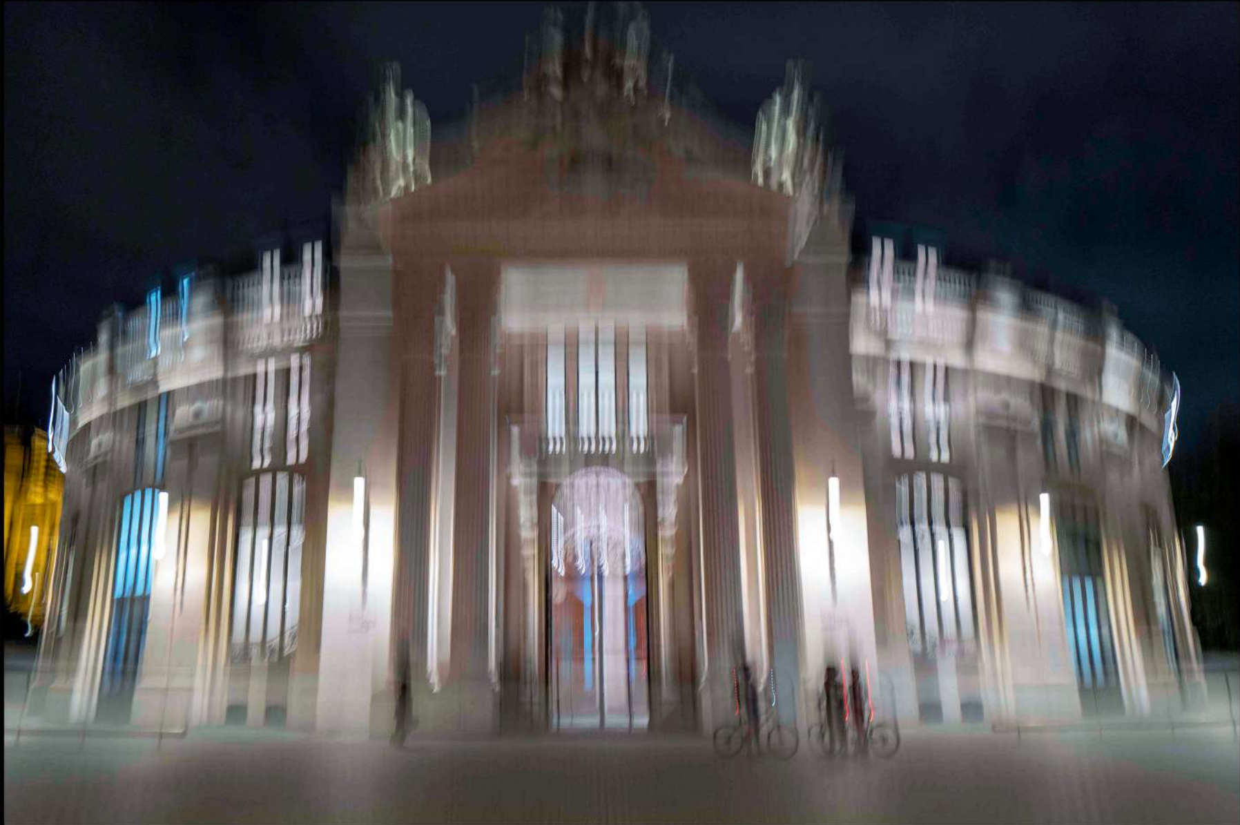
Fondation Pinault spectral - ancienne bourse du commerce