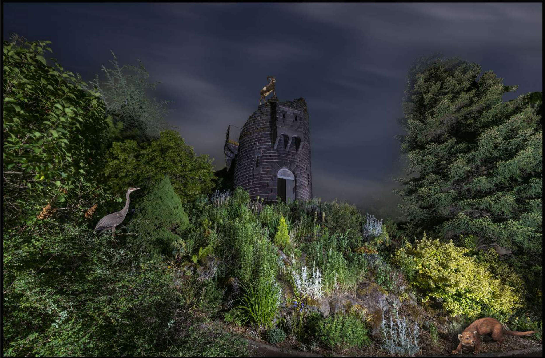
La tour du Mouflon