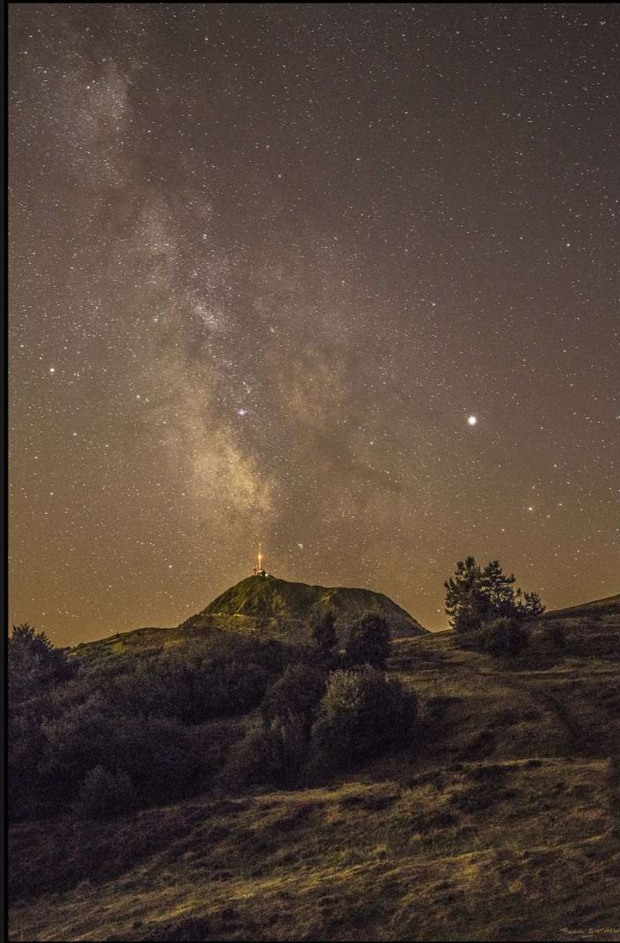
Puy de Dome lactée