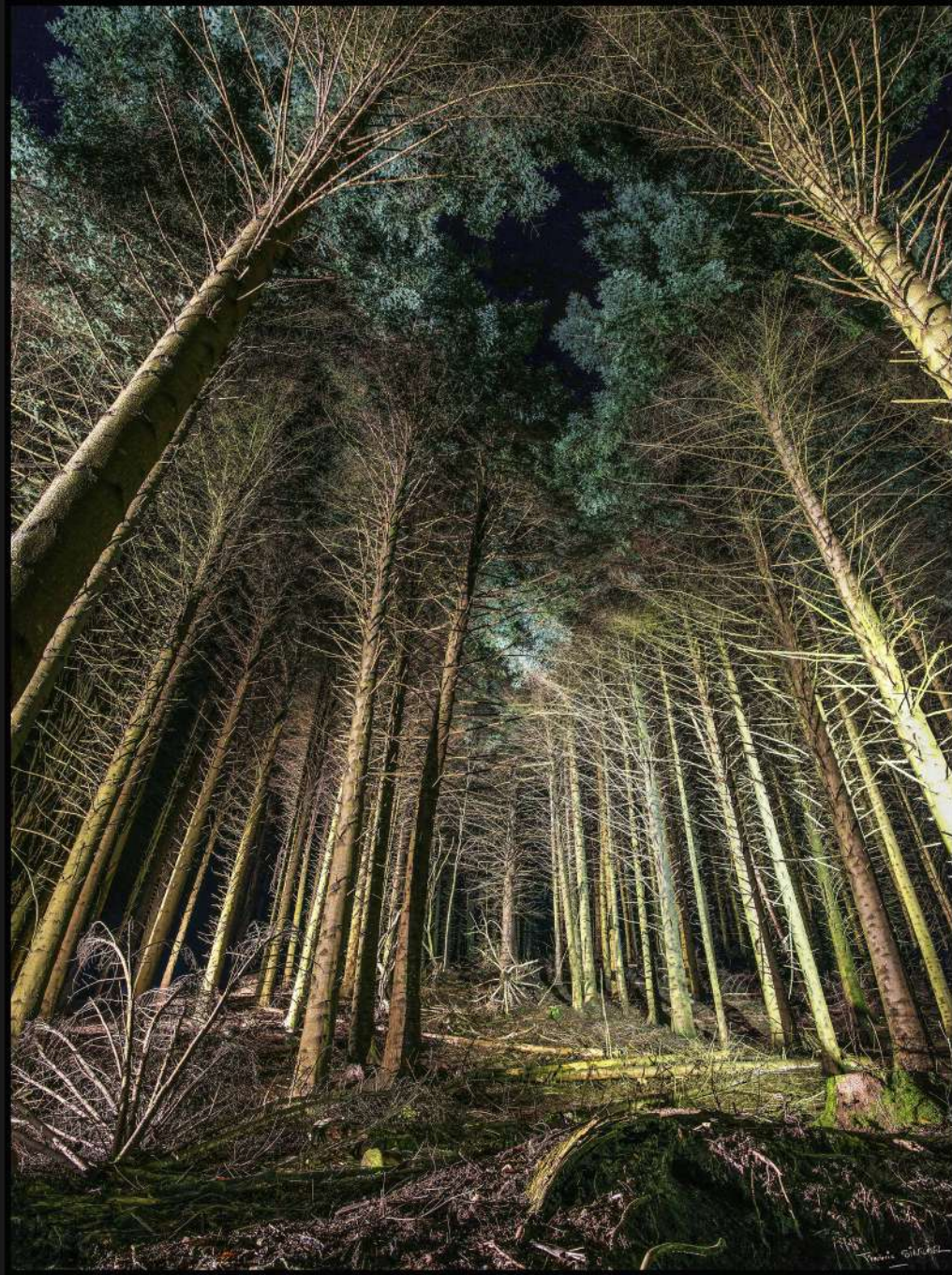
La Foret Magique