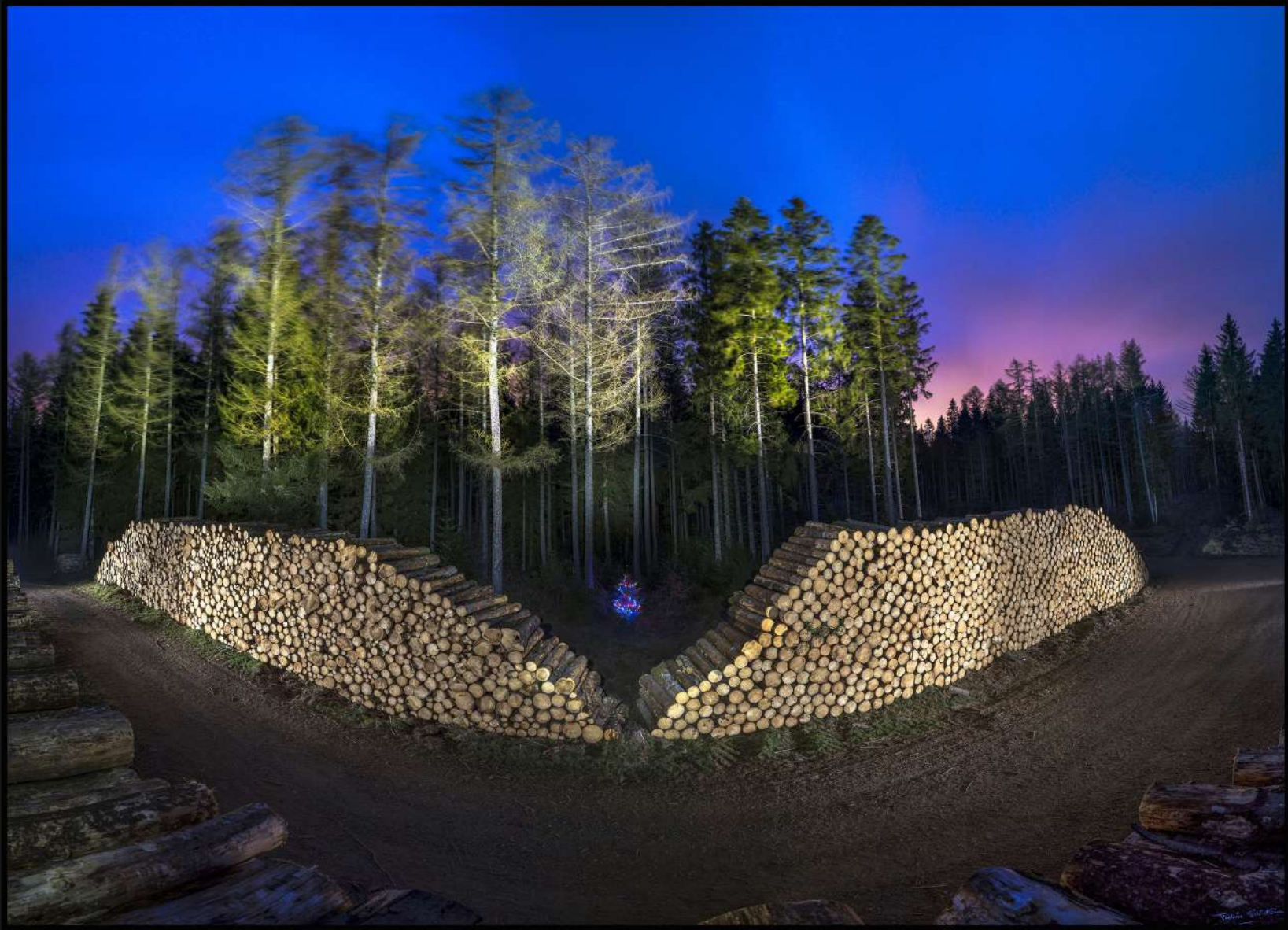
Mon beau sapin