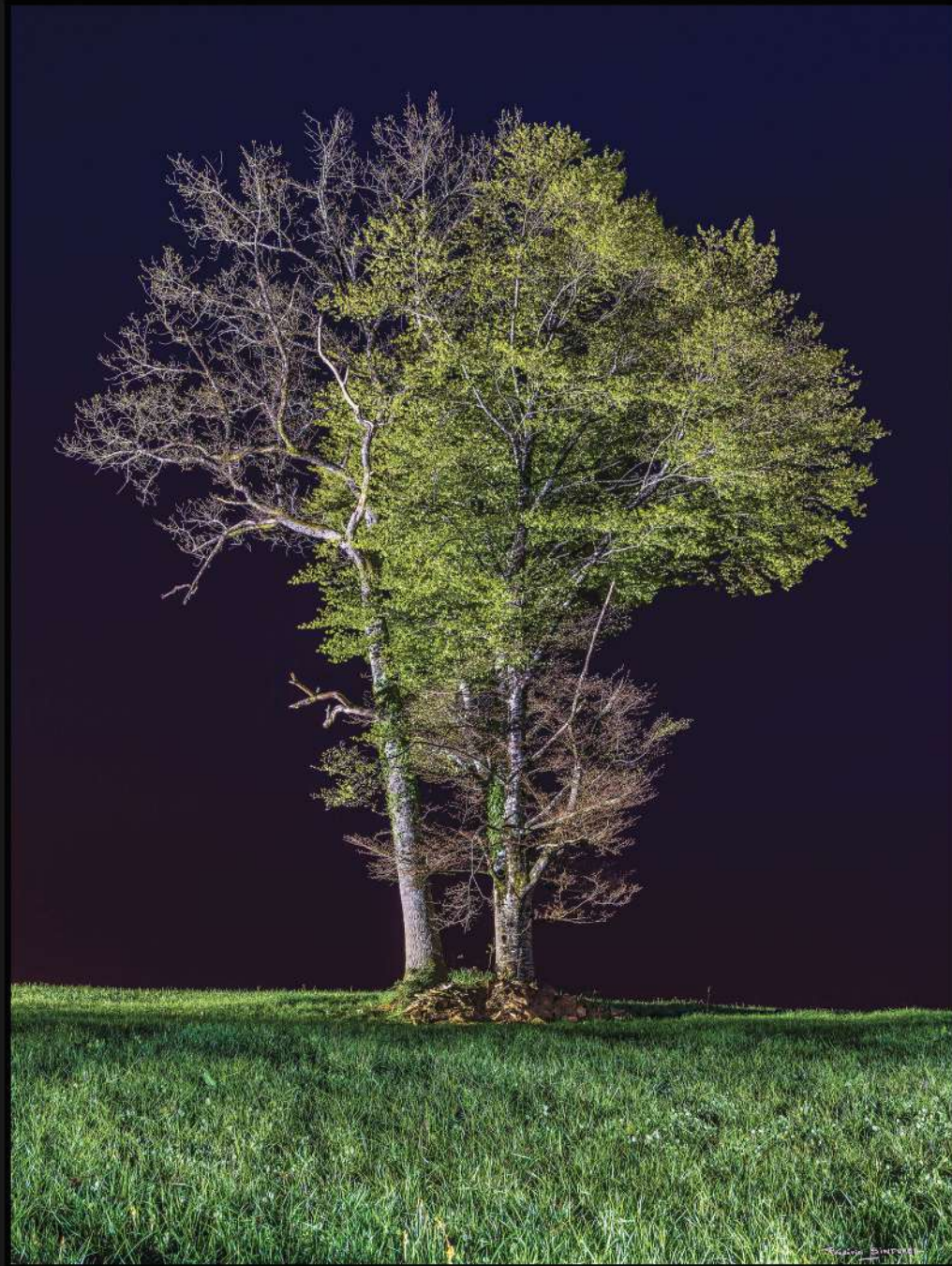
Vie de couple