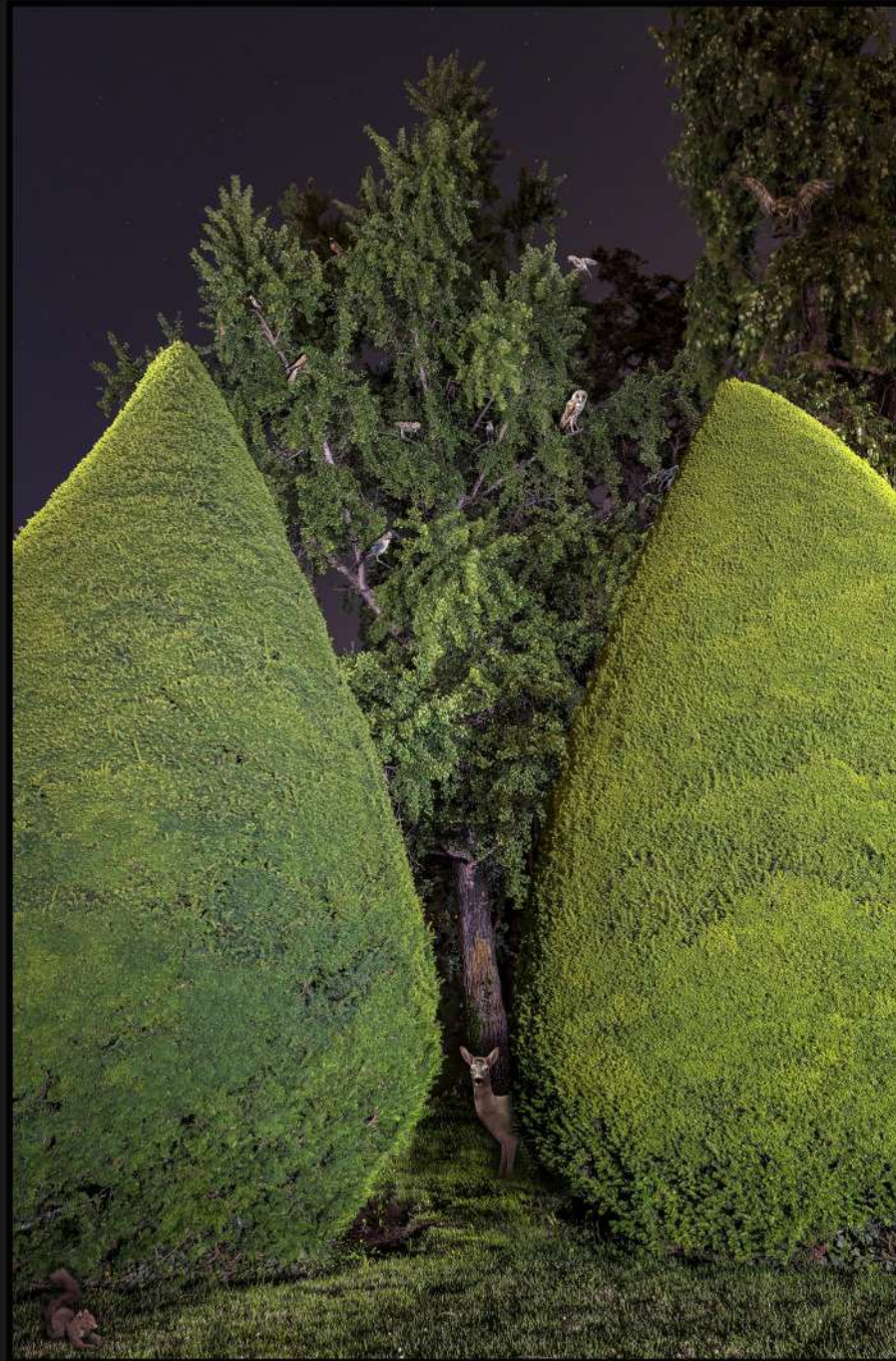
L'arbre aux oiseaux