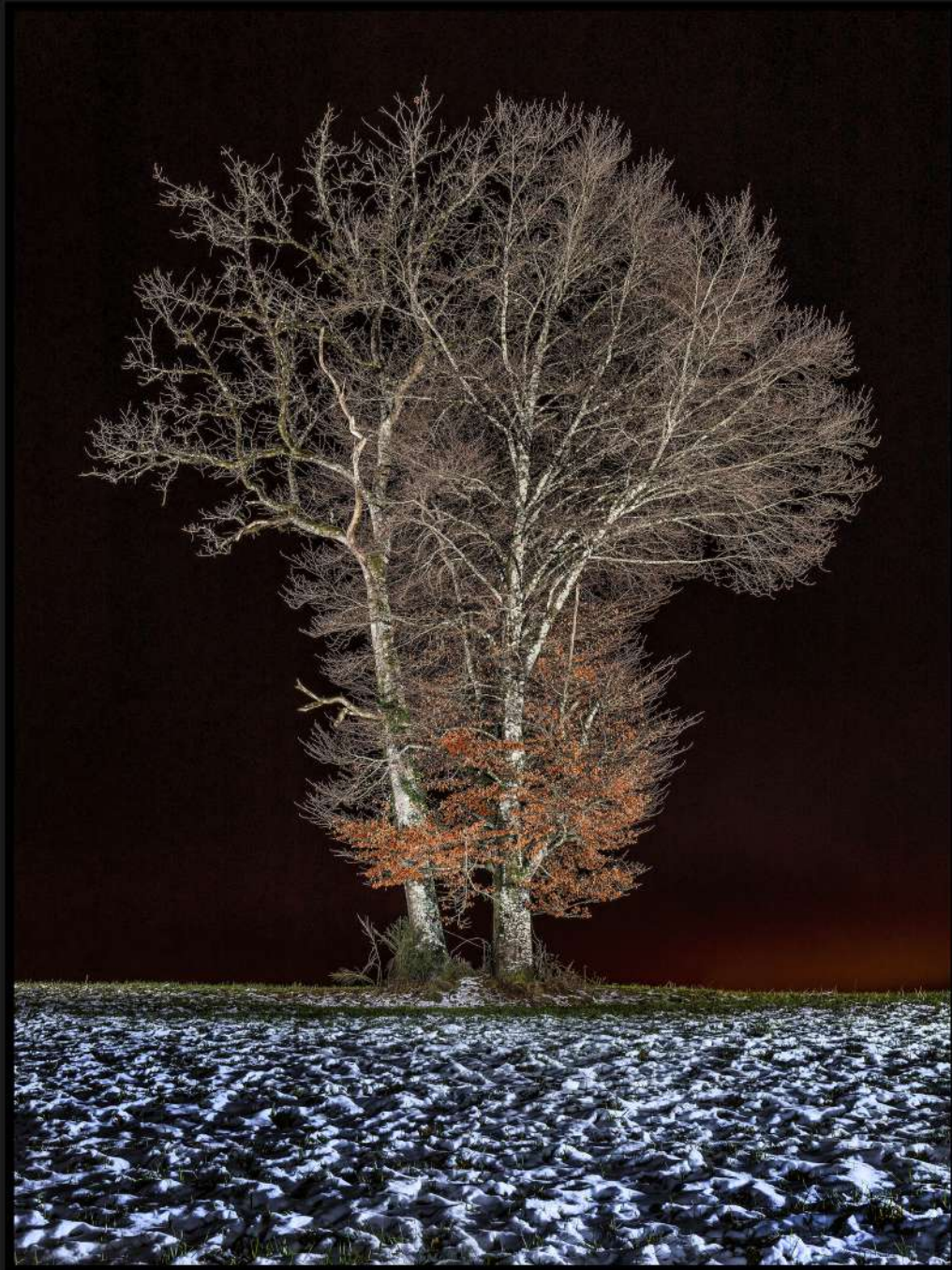
Vie de couple - Hiver