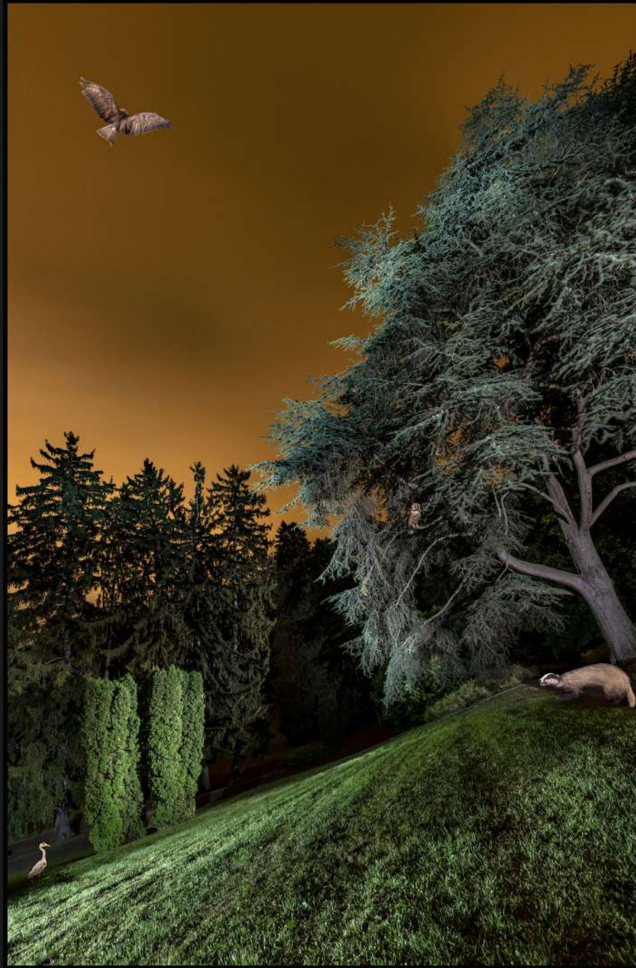
Ciel de blaireau