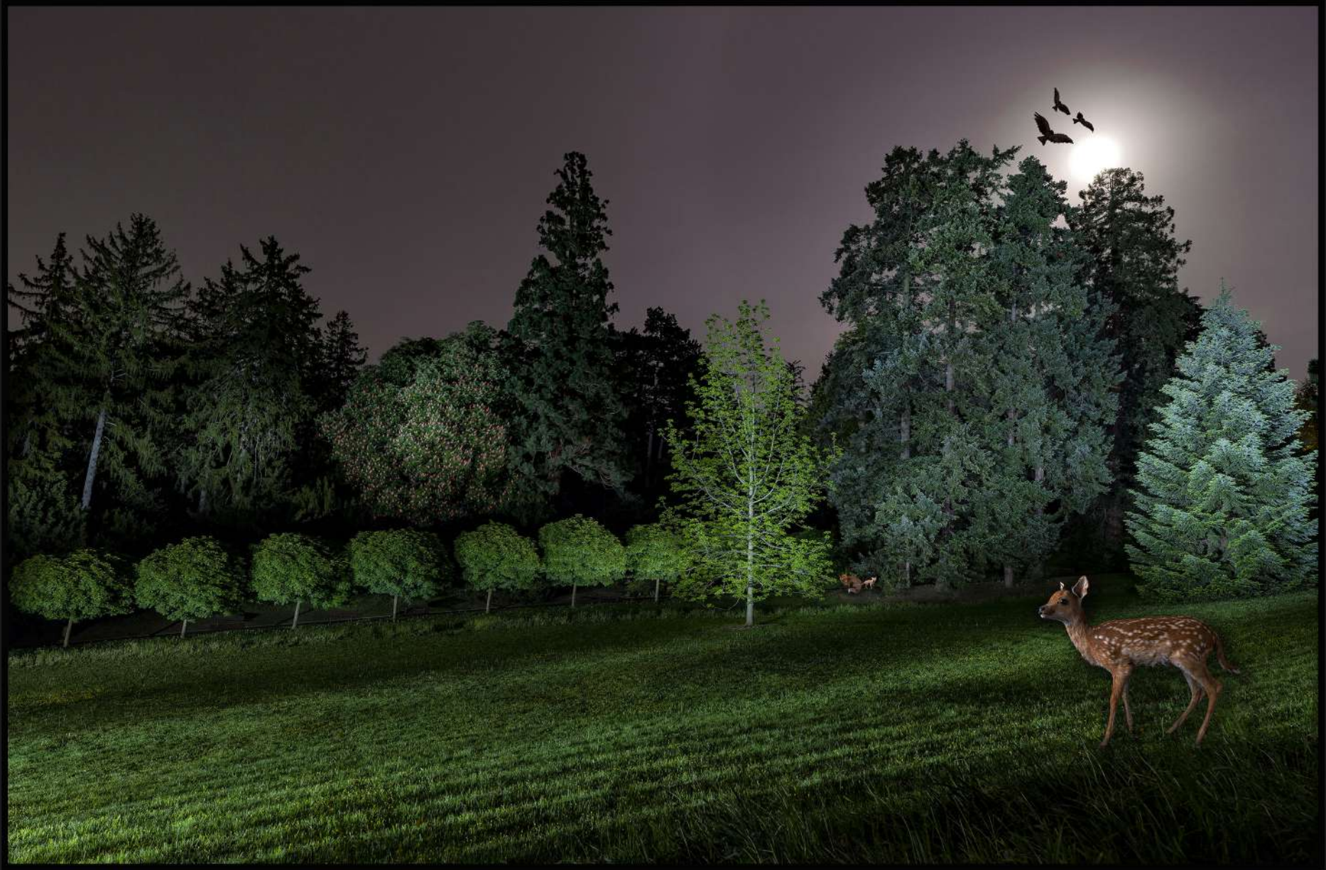
La clairière du renardeau